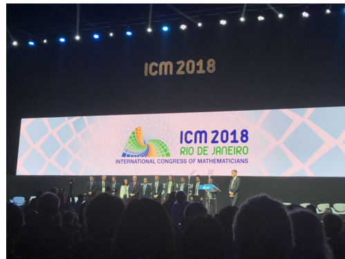
Figure 1: Fieldsprisvinnere under ICM 2018: Caucher Birkar, Alessio Figalli, Peter Scholze og Akshay Venkatesh.

Hver dag begynte typisk med fire plenumsforedrag før lunch, og så en rekke parallellsesjoner med foredrag. Parallellsesjonene gjorde det til tider smertefullt å velge foredrag, og dermed velge bort et annet. Likevel fikk jeg gått på interessante foredrag om blant annet representasjonsteori, numerisk analyse, Coloumb-potensialet, negativ K-teori, resolusjon av singulariteter, Floer-homologi, kombinatoriske triks, dyp læring, kurvetelling og løkkesupper. Noe av dette er langt fra min spesialisering, men foredragsholderne hadde anstrengt seg for å gjøre ideene forståelige for et generelt matematisk publikum. I mer eller mindre grad fikk de frem hvilke problemer som er de viktigste, hva de prøver å finne ut av, skisser av det store bildet, og noen dypdykk i detaljer. Det var gjennomgående hvor godt forberedt foredragsholderne var. Det var også flere korte parallellserier med 15 minutters foredrag kjent som "Short Communications". Vanligvis bør man være litt skeptisk til så korte foredrag for å formidle matematikk, da det har en tendens til å gå litt for fort. Det er som å være på en restaurant der du får servert den ene småretten etter den andre. Aldri nok til å stilne sulten, noen retter smaker nydelig, andre smaker uvant og noen vekker apetitten så du må spørre kokken om mer. Jeg sitter igjen med inntrykk om at jeg burde deltatt på ICM tidligere